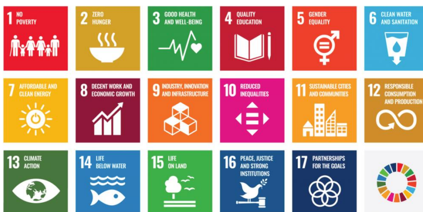
แผนภาพที่ 2 แสดง Sustainable Development Goals: SDGs